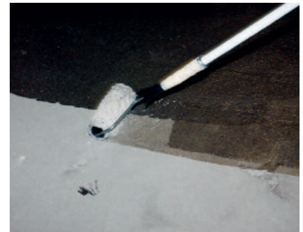
PCI Epoxigrund 390 bzw. PCI Epoxigrund Rapid wird in den vorbereiteten Untergrund z.B. mit einer Flächen-/Malerwalze eingearbeitet.