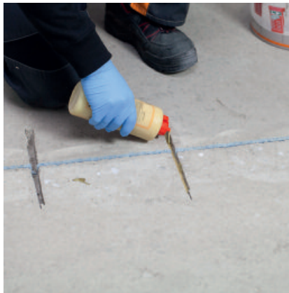
Etwas PCI Apogel® SH vorlegen.