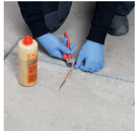
PCI Apogel® Dübel oder Estrichklammern in die Nut einlegen.