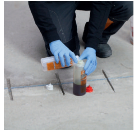
Wenn die zu vergießenden Fugen oder Nuten vorbereitet sind die beiden Komponenten von PCI Apogel® SH zusammenschütten.

Angemischtes Gießharz in die Risse/Fugen oberflächenbündig eingießen und Oberfläche glatt abziehen. Für einen besseren Verbund mit nachfolgenden Bodenausgleichsmassen/Spachtelmassen und Klebstoffen sofort im Anschluss mit trockenem Quarzsand abstreuen. Feine Risse aufgrund der schnellen Erhärtung möglichst innerhalb kurzer Zeit nach dem Anmischen von PCI Apogel SH verfüllen. Bei breiteren Rissen/Fugen ist es besser das angemischte Gießharz in der Flasche kurze Zeit vorreagieren lassen, bis sich eine etwas dickflüssigere Konsistenz eingestellt hat.