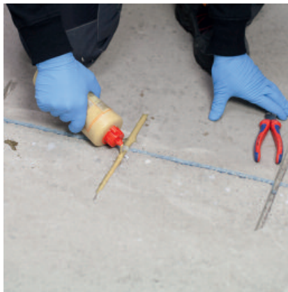
Die Nut oder Fuge komplett mit PCI Apogel® SH ausgießen.