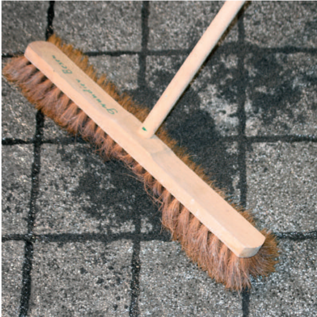
Mörtelreste mit einem weichen Besen vollständig von der Belagsoberfläche entfernen.