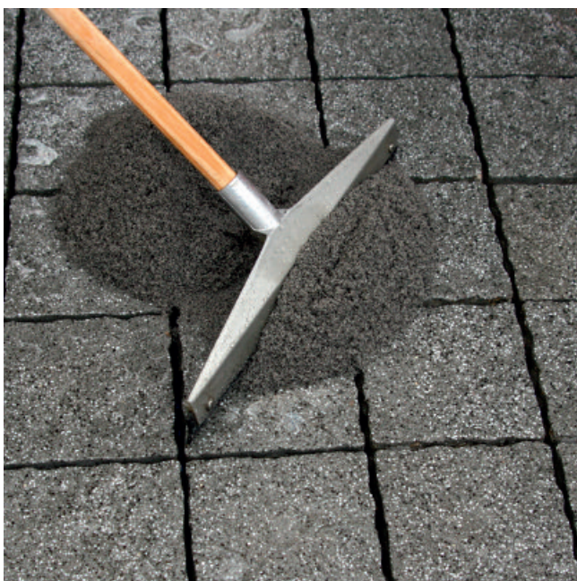
PCI Pavifix 1K Extra mit einem Gummischieber unter Druck in die Fugen einarbeiten.