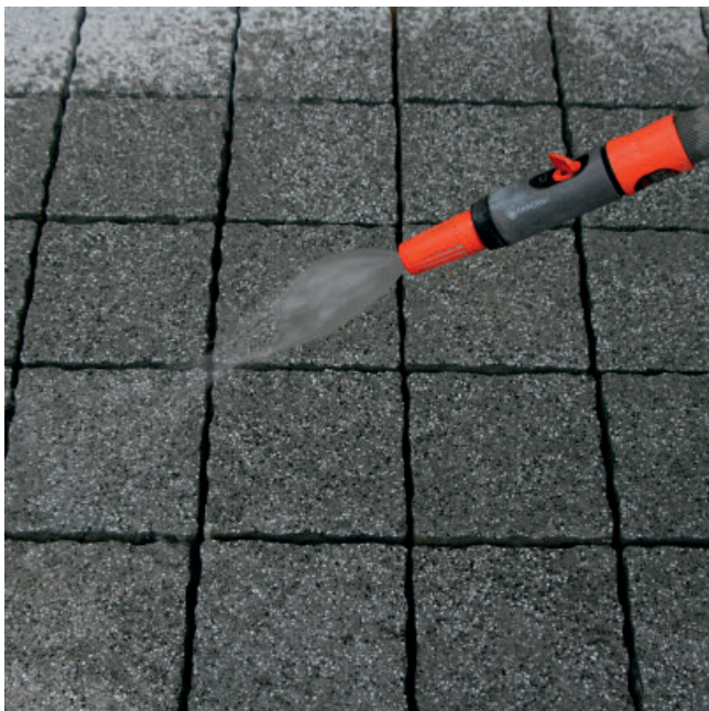
Steinoberfläche und Fugenflanken vor der Verfugung kräftig vornässen.