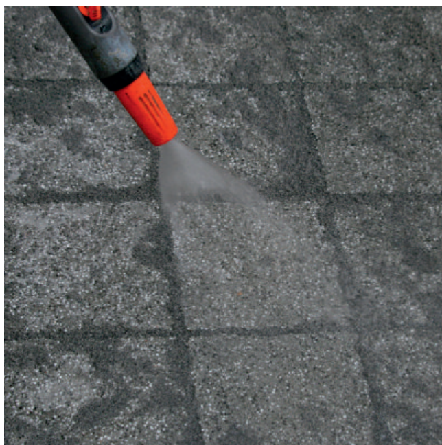
Bei Fugen von 3 - 8 mm das Einbringen in die Fugen mit dem Wasser- strahl unterstützen. Bei besonders schmalen Fugen den Wasserstrahl ent- lang den Fugen führen. Nachgesackte Fugen sofort mit frischem Material auffüllen.