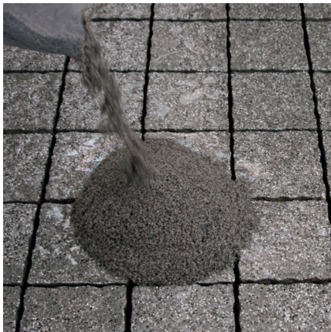
Vakuumbutel aufschneiden und frisches Material auf die nasse Belags- oberfläche schütten.