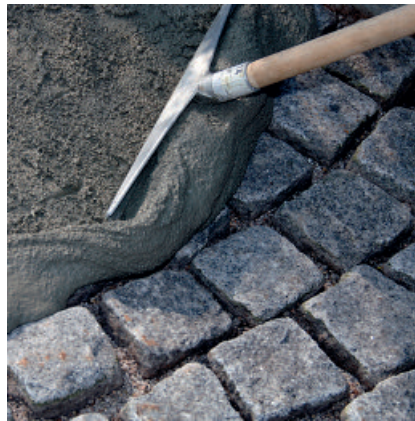
PCI Pavifix CEM Rapid mit einem Gummischieber in die Fugen einarbeiten. Die Belagsoberfläche mit einem leichten Sprühstrahl feucht halten.