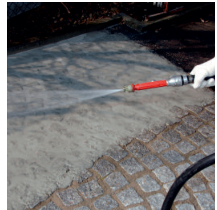
Anschließend erfolgt das Abreinigen mit dem Wasserschlauch. Um beim Reinigen der Pflastersteine ein Ausspülen der Fugen zu vermeiden, ist der Wasserstrahl nahezu horizontal zur Oberfläche zu halten.