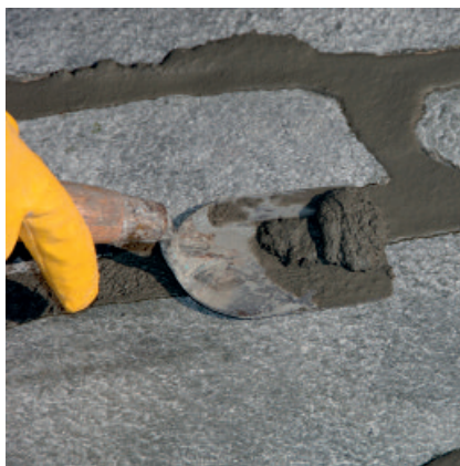
Nach Anziehen des Mörtels (Fingerkuppentest) Überstand mit einer Spachtel abstechen.