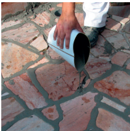
Pavifix CEM Rapid mit einem geeigneten Gießgefäß in die vorbereiteten Fugen einbringen.