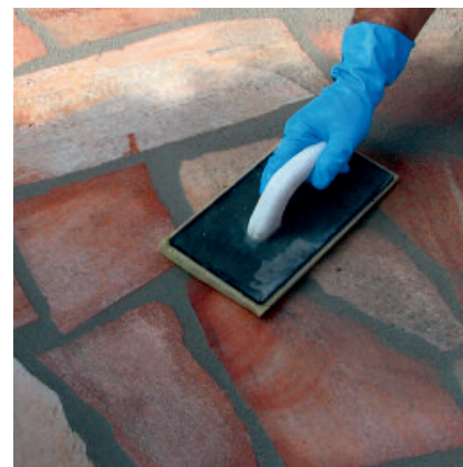
Anschließend Plattenbelag mit einem Schwammbrett nachwaschen.