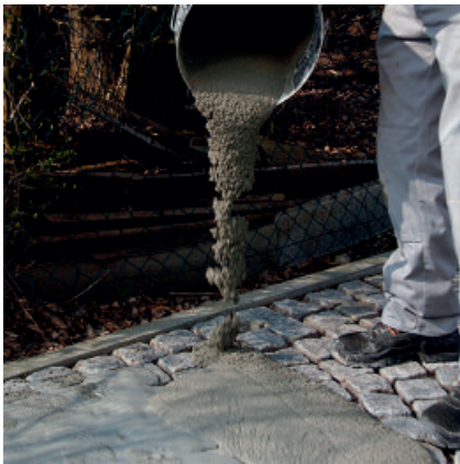
Aufbringen von PCI Pavifix CEM Rapid auf die sorgfältigste vorgewässerte zu verfugende Fläche.