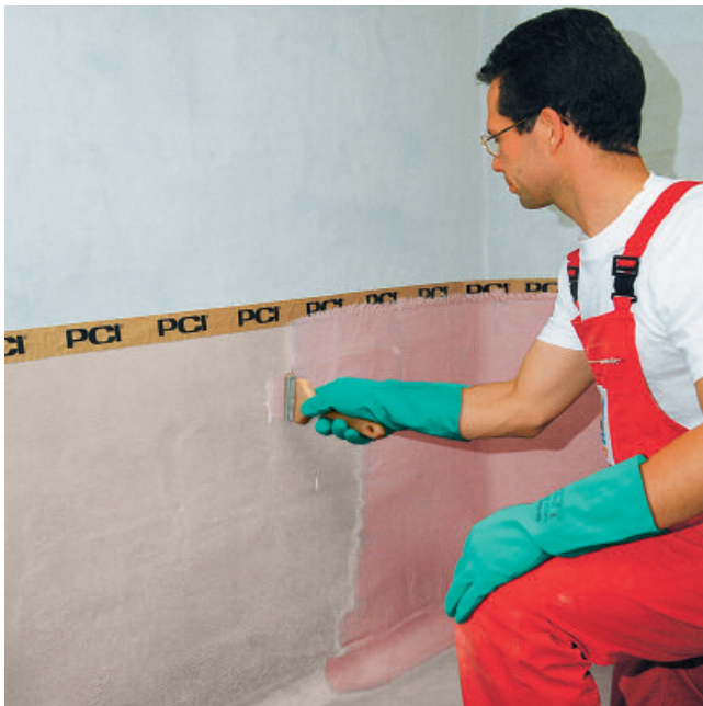
Auf die mit 50 % Wasser verdünnte PCI Visconal grundierte Fläche (grau) kann nach ca. 8 Stunden Trocknungszeit der erste Deckanstrich mit PCI Visconal (rot) aufgestrichen werden.

5 Nach frühestens 7 Tagen ist die Beschichtung völlig durchgetrocknet und belastbar.