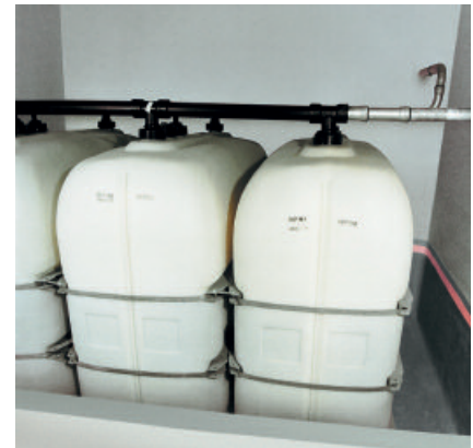
Heizöllagerraum mit PCI Visconal-Schutzbeschichtung.