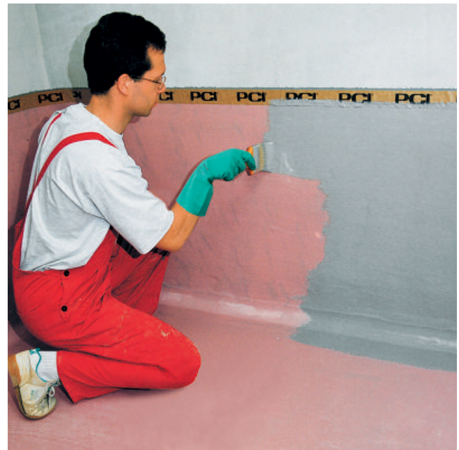
Da für eine öldichte Beschichtung mindestens eine Grundierung und zwei Deckanstriche erforderlich sind, ist nach weiteren ca. 8 Stunden Trocknungszeit der zweite Deckanstrich mit PCI Visconal (grau) aufzutragen.