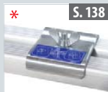
Klemmbeschlagset für Treppenstellung