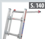
Wandabstandshalter für Sprossenleitern