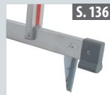
Fußspitzenset für Traversen