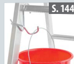
Eimerhaken für Sprossenleitern