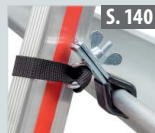
Leiterhalterset für Dachrinnen