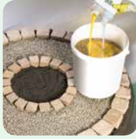
Splittbinder dem Mineralstoff zugeben