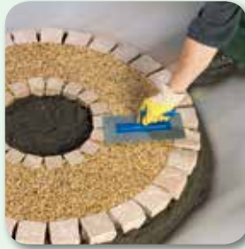
verdichten und glätten