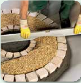
über Lehren abziehen