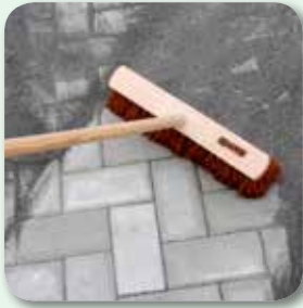
vdw VarioSand einfeigen und von der Oberfläche abfeigen