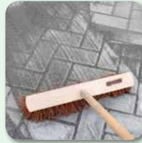
Anschließend nachsanden und erneut abrütteln. Danach rückstandsfrei abfeigen und ggf. Fasen freilegen