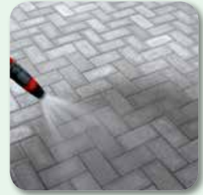
Fläche ausreichend wässern. Nachbehandlung beachten!